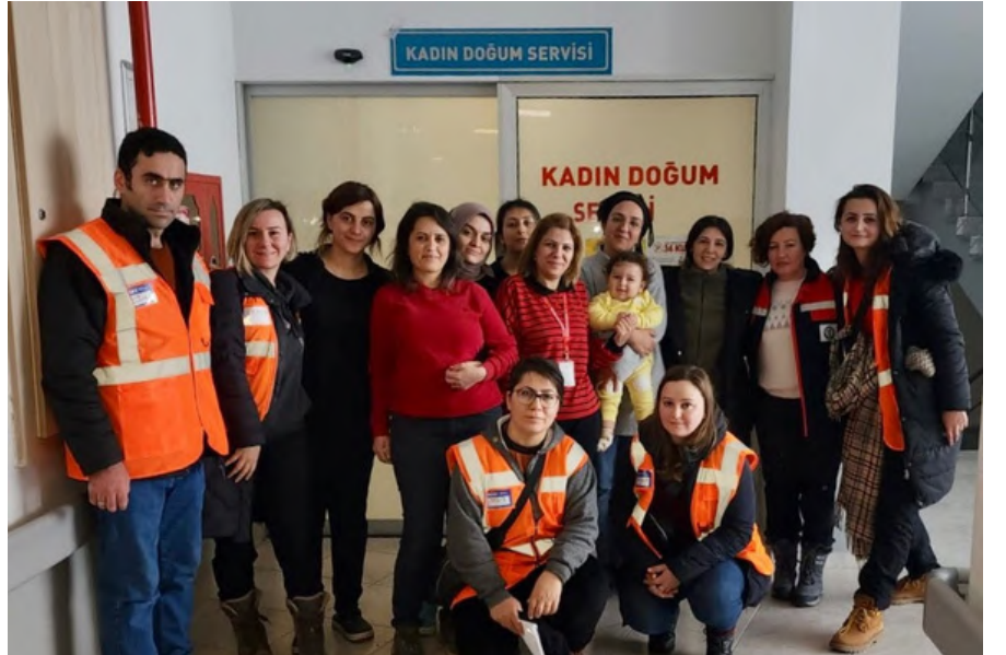
BARÜ (Bartın Üniversitesi) deprem bölgesi proje ekibi

Sütünü sağarak bebeğini besleyen ebeveynlerin sütünü elle nasıl sağacağını ve bebeğini bir bardakla nasıl besleyeceğini bildiğinden emin olunmalıdır. Sağmak için araç kullanılması durumunda süt sağma pompasının temiz su ile temizlenmesi gereklidir. Her durumda sağılan süt buzdolabında saklanmalıdır.