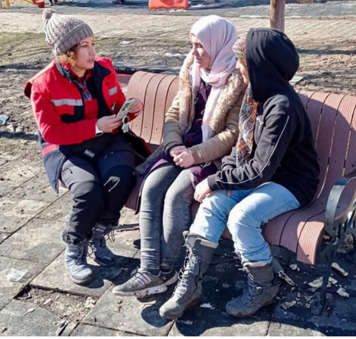
BARÜ (Bartın Üniversitesi) deprem bölgesi proje ekibi