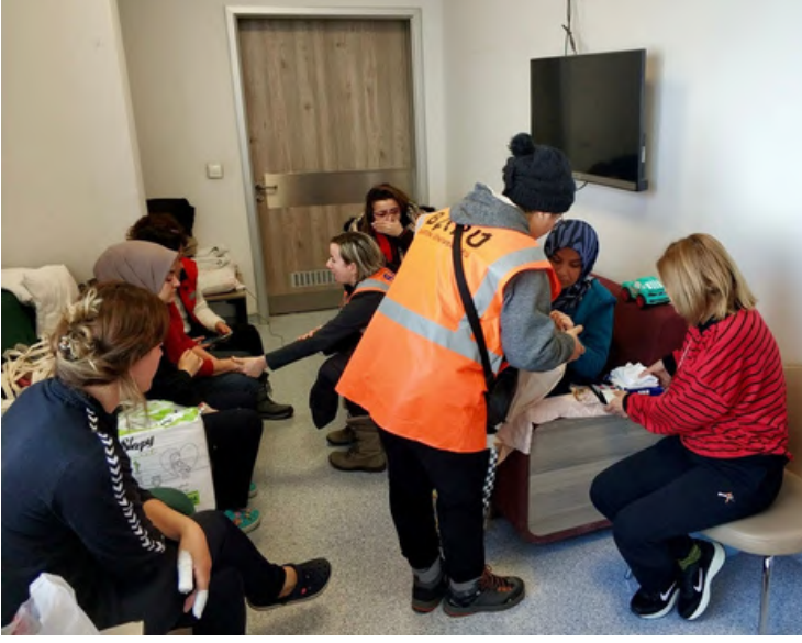
BARÜ (Bartın Üniversitesi) deprem bölgesi proje ekibi

Depremden sonra yerde moloz, cam gibi bebeğe zarar verebilecek ve taşımaya zorlaştıracak eşyalar olduğundan puset veya bebek arabası kullanımı zor ve tehlikeli olabilir. Bu nedenle hareket ederken bebeği kucakta taşımaya yönelik taşıyıcı (kanguru vb.) kullanılmalıdır.