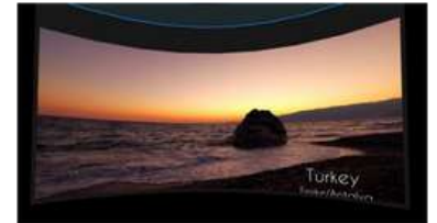
Resim 6. Deniz Manzarası