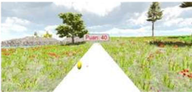
Resim 4. Altın Toplama Oyunu

Tasarlanan oyunları, " Kasılmalar Sırasında Oynanacak Oyunlar" ve " Kasılmalar Sonrasında Oynanacak Oyunlar " şeklinde 2 gruba ayırdık. "Kasılmalar Sırasında Oynanacak Oyunlar " kategorisinde 4 oyun yer aldı. Bu oyunlar ;derin solunum egzersizi ve kademeli solunum egzersizlerini içeren "Tek Nefeste Balon Şişirme Oyunu" ve " Kademeli Balon Şişirme Oyunu" olarak adlandırdığımız oyunlar, çömelleme egzersizini içeren " Balon Patlatma Oyunu "ve sallanma egzersizini içeren "Altın Toplama Oyunu" dur. Kasılmalar sonrasında ise gebeye gevşeme egzersizleri yapabileceği iki adet doğa ve deniz manzarası içeren videolar izlettik. Gebelerin, tasarlanan bütün oyunları en az bir kez oynamasını sağladık. Oyunların veya videoların oynanma ve izlenme sırasını gebelerin tercihine bıraktık. Çalışmamızın sonucunda; süreci sanal oyun oynayarak yöneten gebelerin doğum ağrılarının önemli ölçüde azaldığını ve doğum sonu memnuniyet düzeylerinin de arttığını gözlemlemiş olduk.