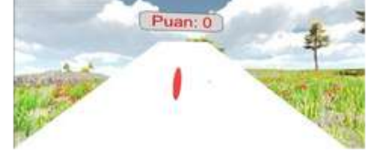
Resim 3. Balon Patlatma Oyunu