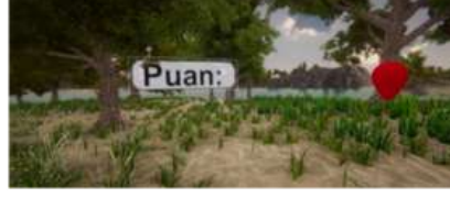
Resim 2. Kademeli Balon Şişirme Oyunu