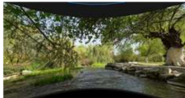
Resim 5. Doğa Manzarası