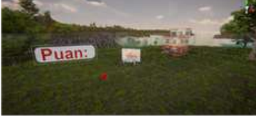
Resim 1. Tek Nefeste Balon Şişirme Oyunu